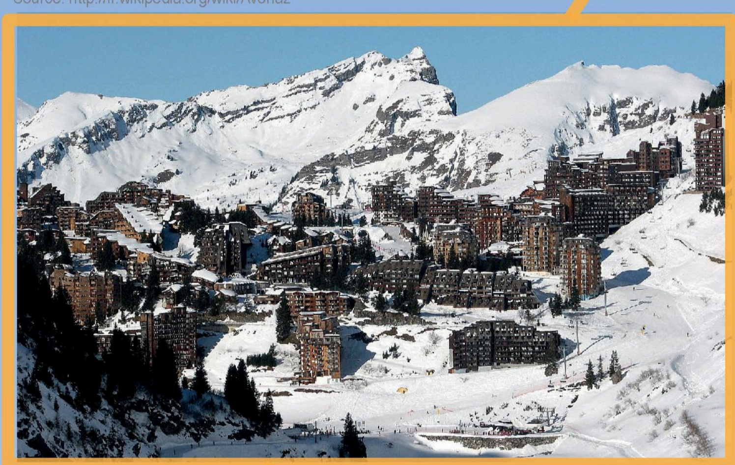
Supérieur à 1800m