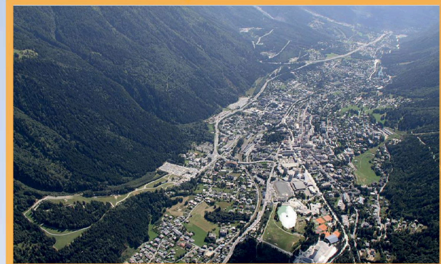
De 900 à 1200m