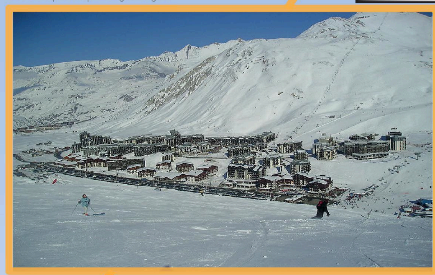
De 1400 à 1800m